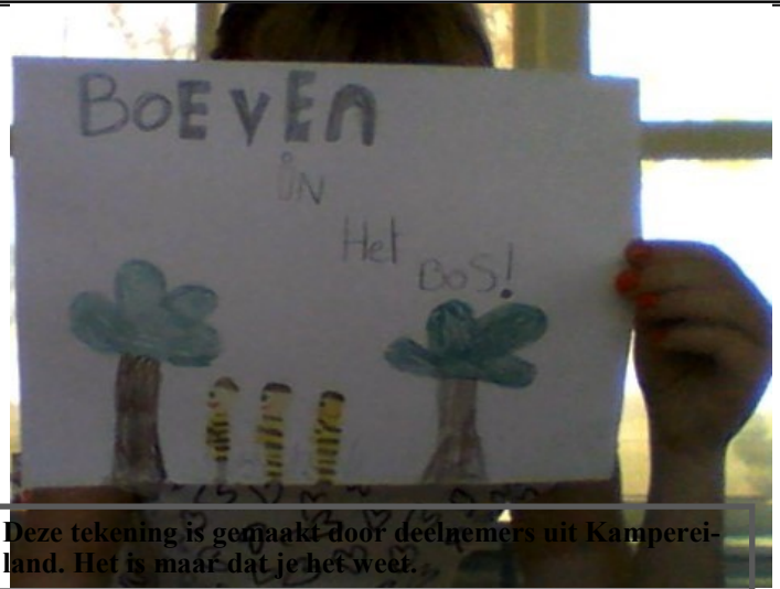
Deze tekening is gemaakt door deelnemers uit Kampereiland. Het is maar dat je het weet.